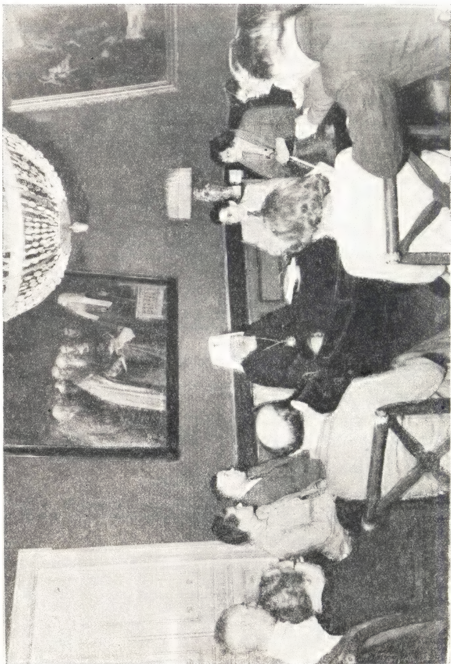
АНГЛИЙСКИЕ УЧИТЕЛЯ НА ПРИЕМЕ В МОСКОВСКОЙ ПАТРИАРХИИ